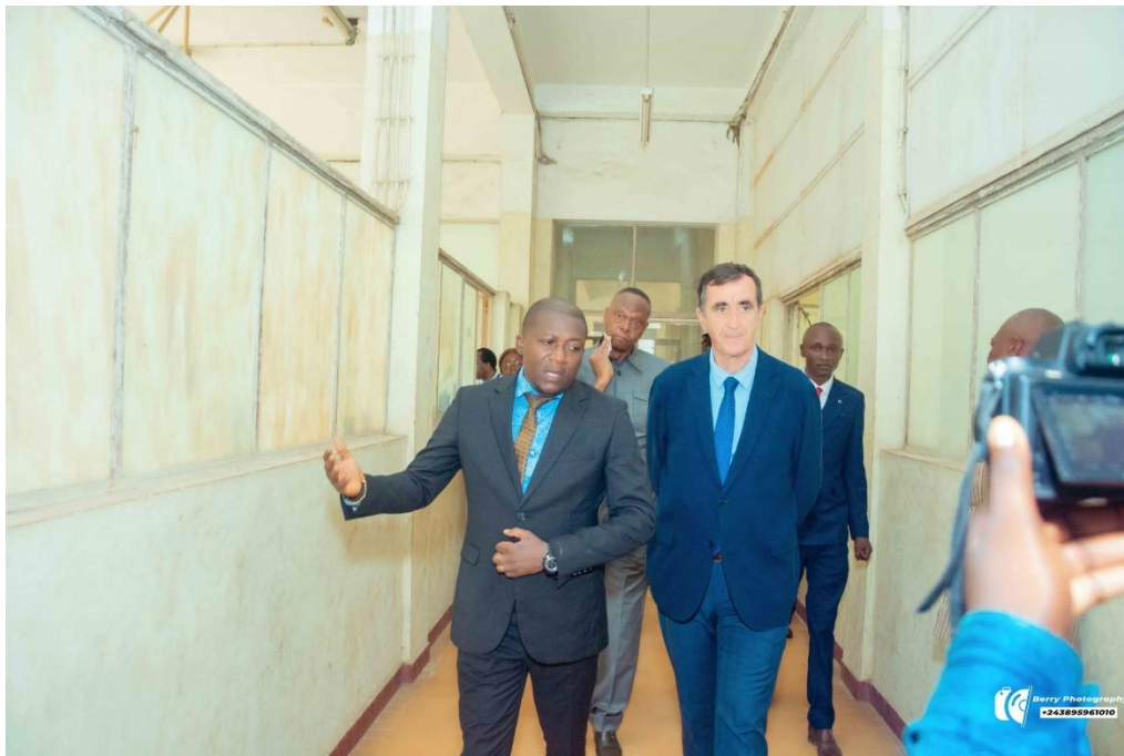
Visite guidée des quelques installations (salles des cours et laboratoires) éducationnelles de l'IFA-Yangambi par SEM I4 ambassadeur de l'Union Européenne en RD Congo avec toute sa délégation.