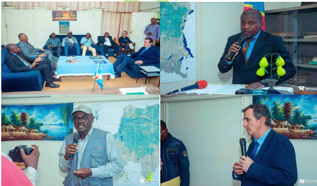
Moment convivial des prises de paroles et d'échanges avec SEM l'Ambassadeur et la délégation qui l'accompagne, au bureau du Recteur de l'Institut Facultaire des Sciences agronomiques de Yangambi le mardi 25 juin 2024. Ce moment marque un des temps forts de cette journée.